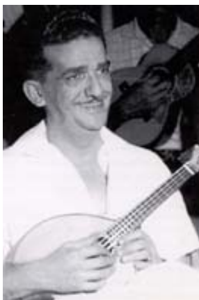
Figura rígida e disciplinada, tanto na personalidade quanto na música, pesquisou e resgatou parte do repertório tradicional do choro, repertório este que passou a incluir várias de suas composições, como "Noites Cariocas", "Receita de Samba", "A Ginga do Mané", "Doce de Coco", "Assanhado", "Trem-trem", "Vibrações" e "O Vôo da Mosca". Depois de montar o grupo Jacob e

Apesar de se apresentar tocando em conjuntos instrumentais desde cedo, nunca se profissionalizou totalmente, tendo sempre outros empregos não relacionados à música. Foi vendedor, prático de farmácia, corretor de seguros, comerciante e escrivão de polícia, cargo que ocupou até morrer. Por não depender financeiramente da música, Jacob pôde tocar e compor com mais liberdade, sem sofrer pressões de gravadoras ou editoras.